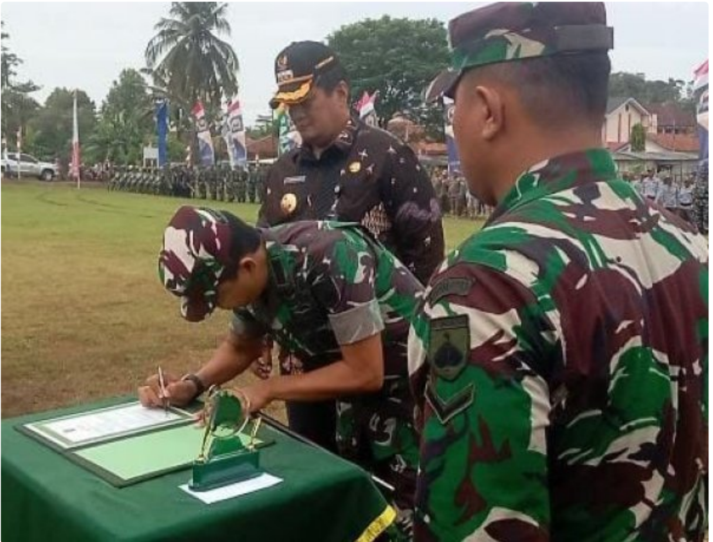
TMMD Kodim 0703/Cilacap di Desa Bojong, Jembatan Percepatan Pembangunan dan Pemberdayaan Masyarakat

CILACAP - TMMD Sengkuyung Tahap I Kodim 0703/Cilacap tahun 2025 di Desa Bojong, Kecamatan Kawunganten, Kabupaten Cilacap telah resmi dibuka oleh Pj.